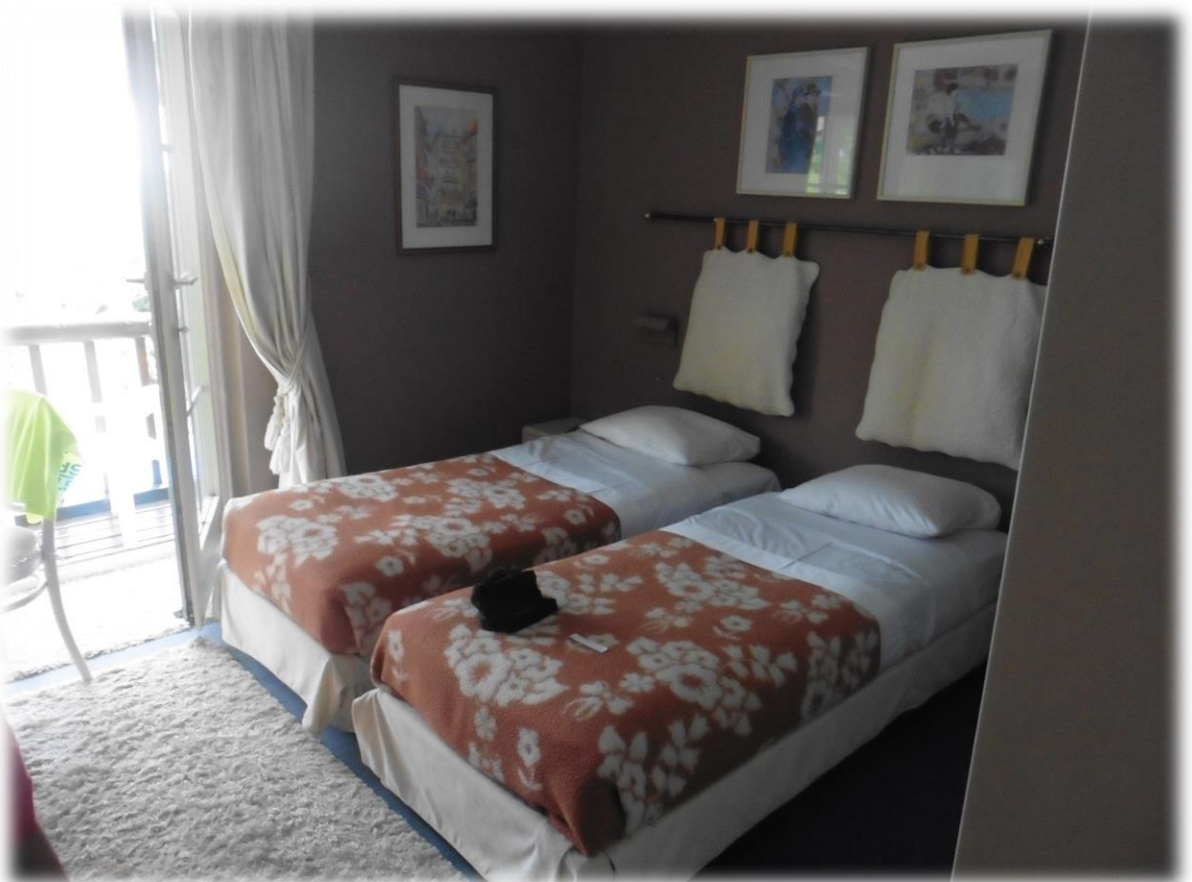
We logeren in een B&B in Nadrin. De uitbater is afkomstig van Antwerpen.