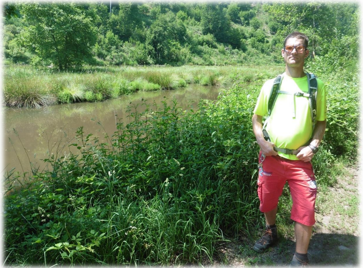
Ten oosten van Gouvy, op 47 km van hier, borrelen de verspreide bronnen van de Oostelijke