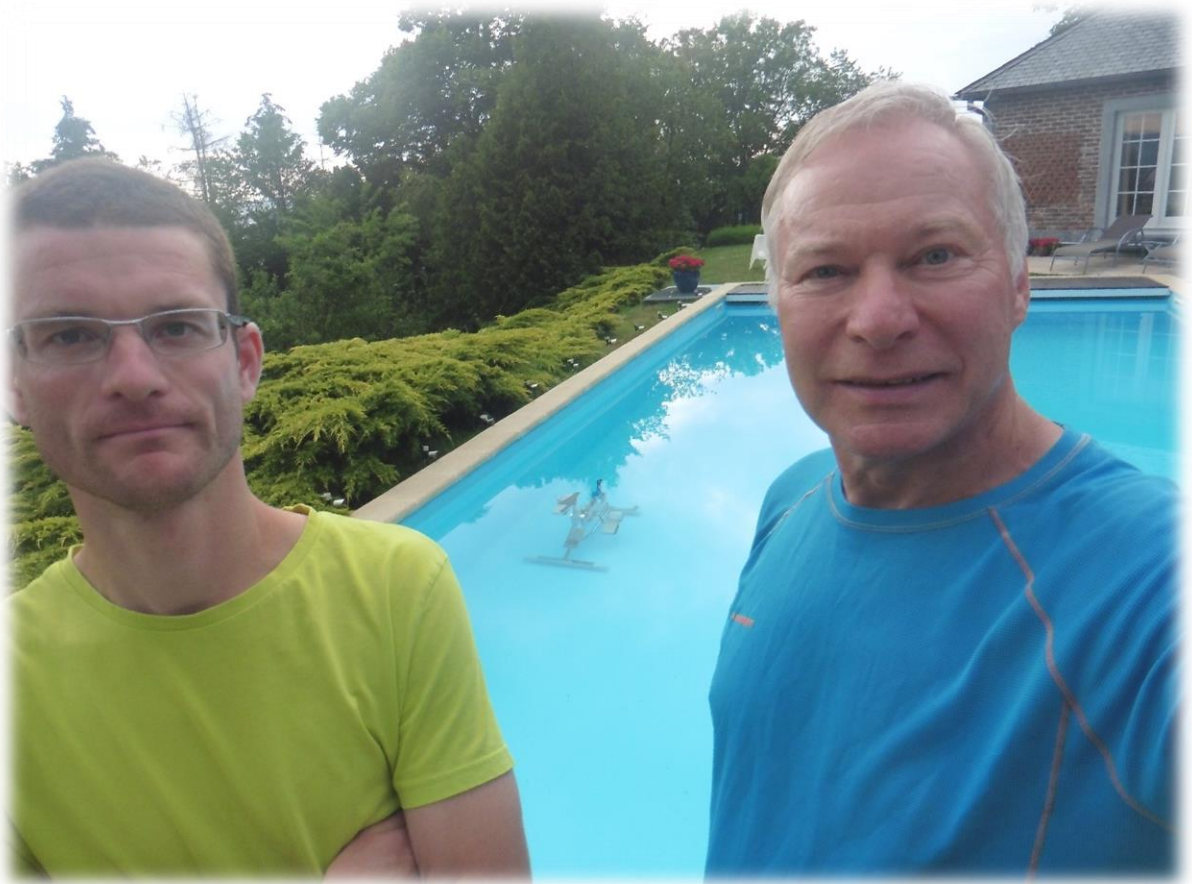
In het zwembad kan je niet alleen zwemmen maar ook fietsen!